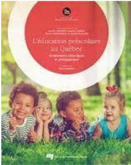
Paquette et al. (2021)